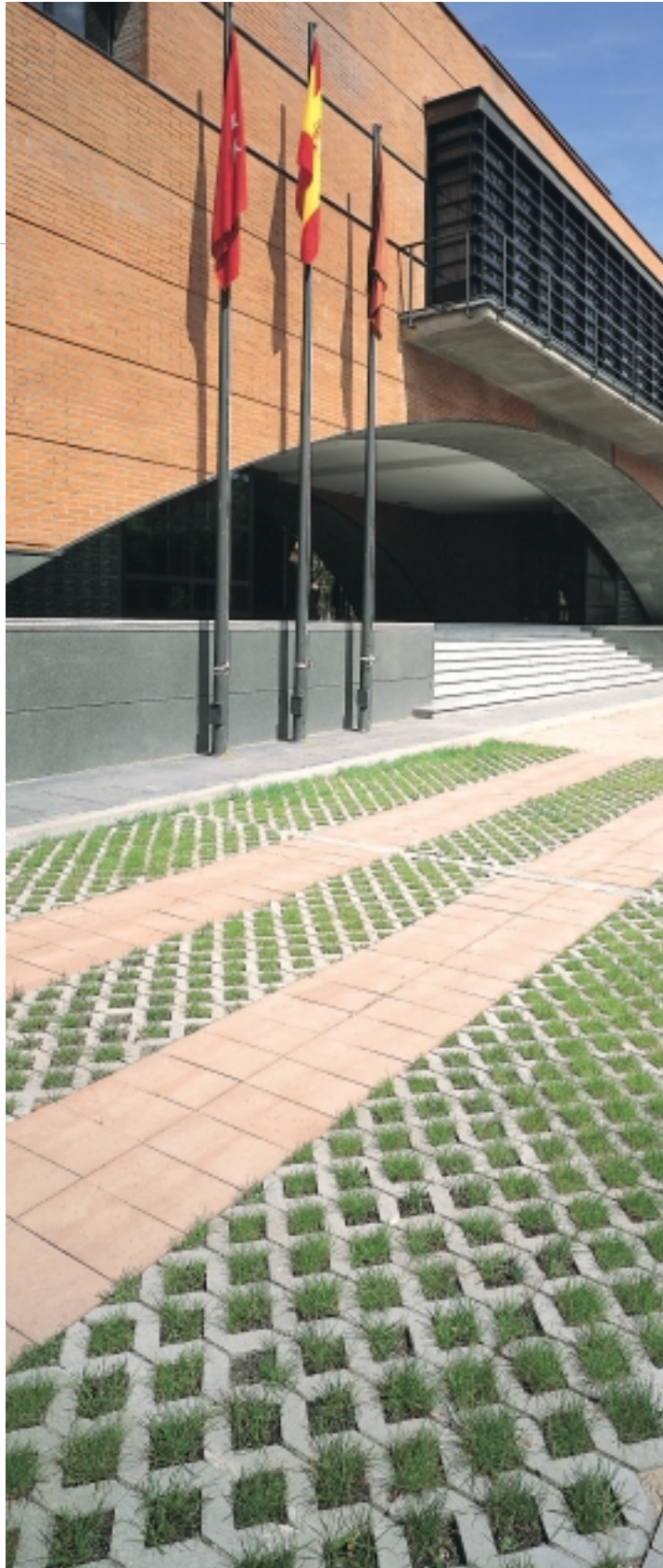
Universidad Carlos III, Getafe.