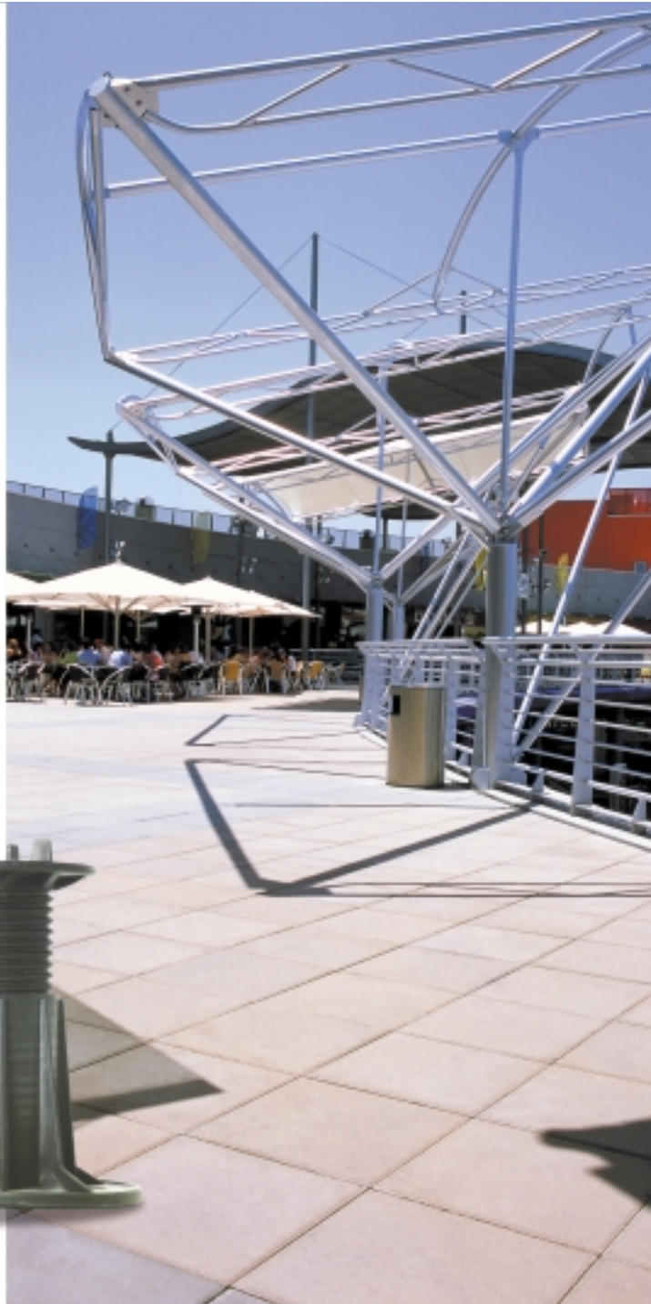
Centro Comercial Diversia en Arroyo de la Vega, Alcobendas. Pavimentación realizada sobre soportes de termoplástico reforzado.