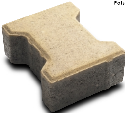
Adoquín Lur H