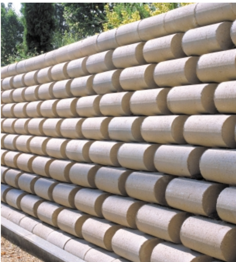
Casa de Campo (Madrid)