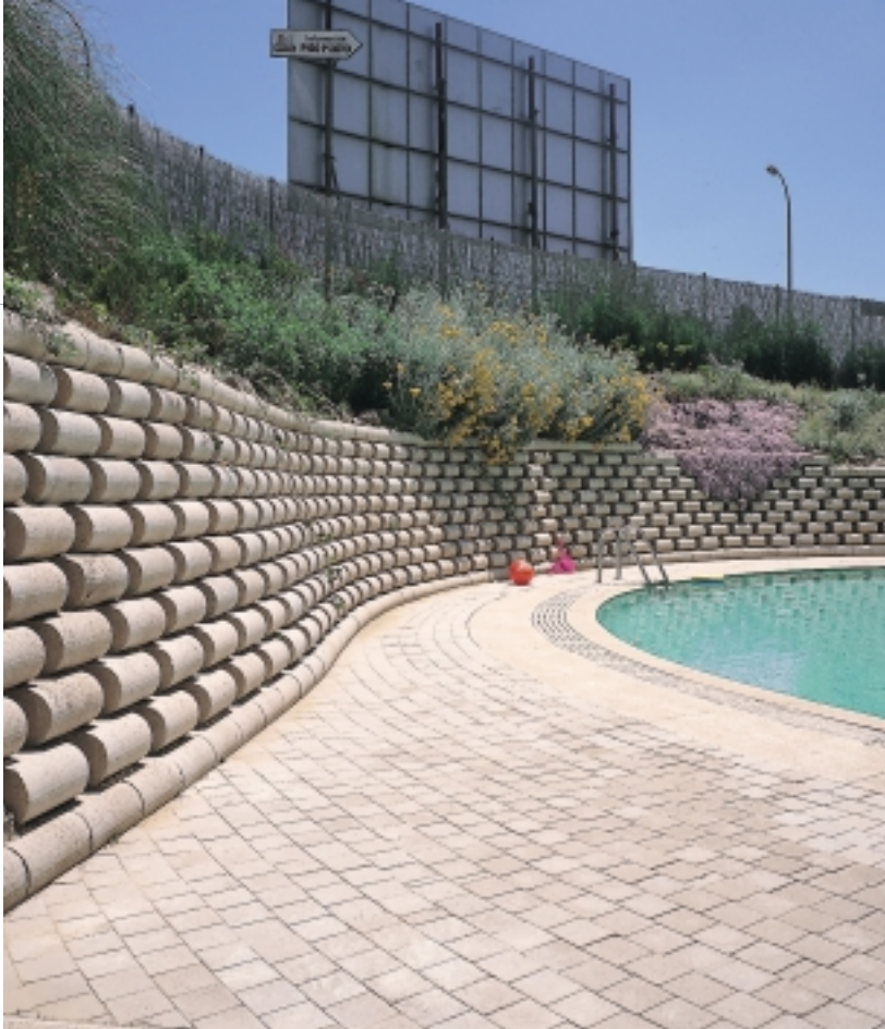
Calle Torrelaguna, Madrid