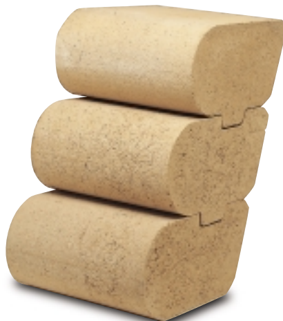
Detalle Muro Wall